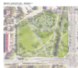
Plac Domagały - Koncepcja 2 Mapa