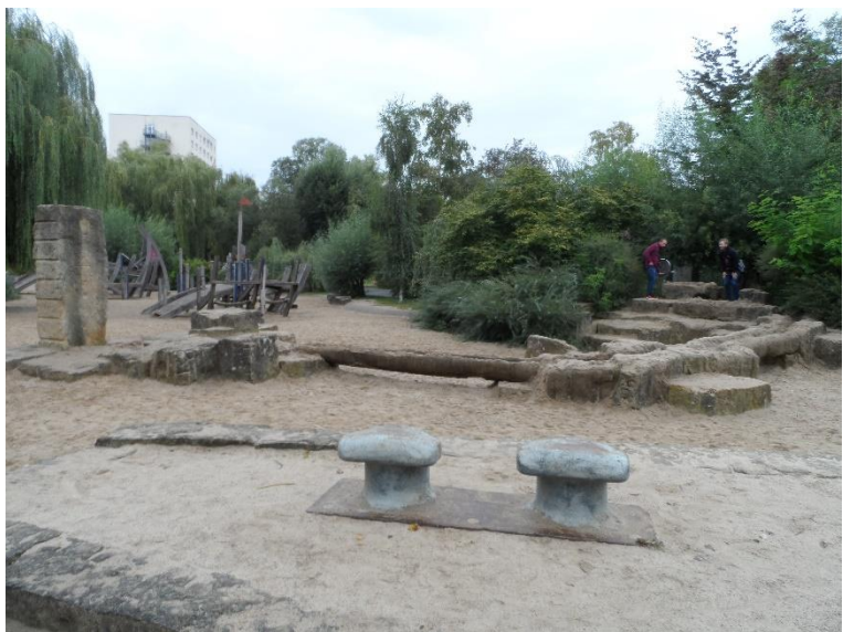
Ilustracje do ankiety nr 187, pyt. 4.