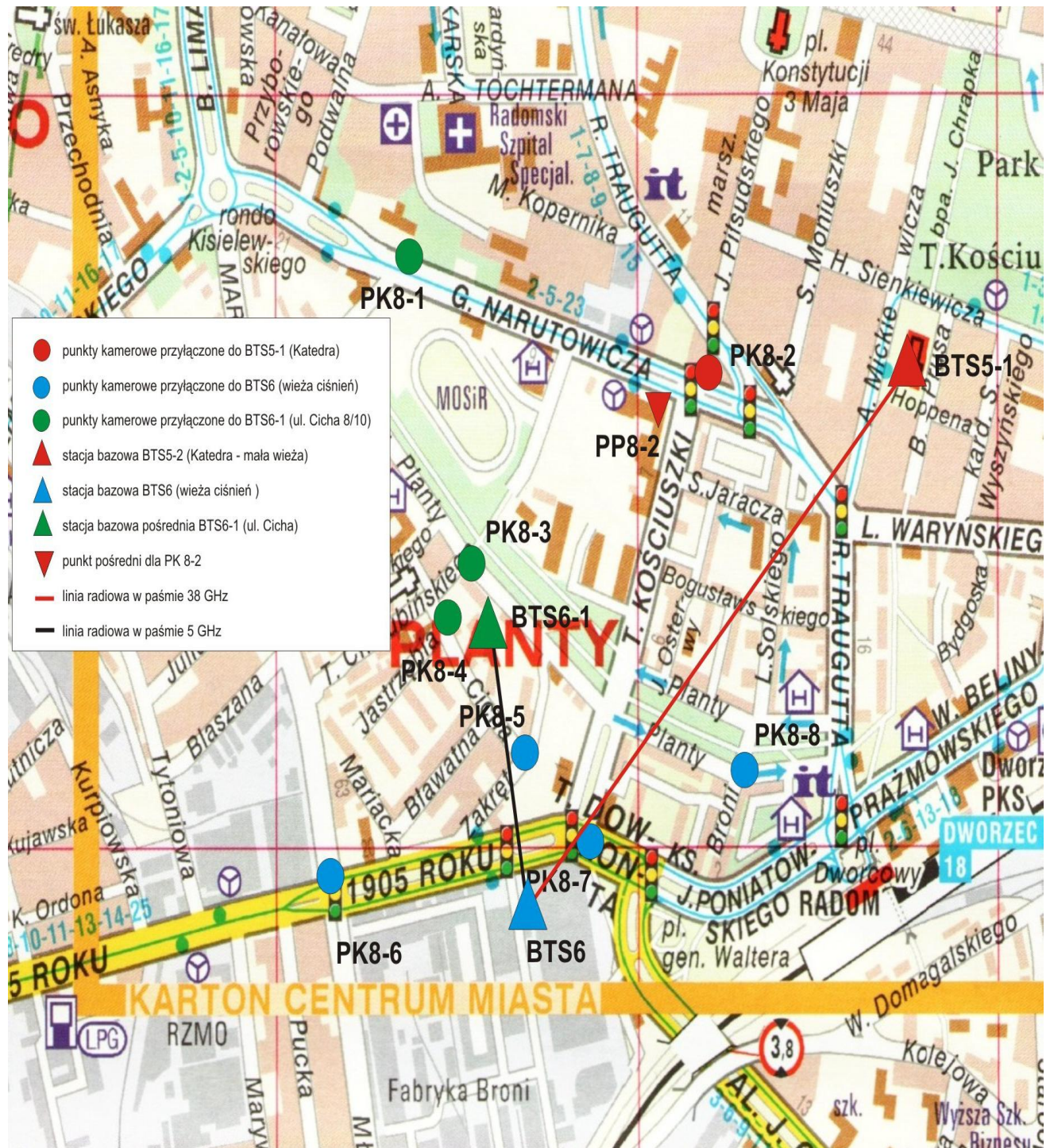
Zdj.1. Lokalizacja PK i stacji bazowych

Lokalizacja stacji bazowych i kamer oraz Schemat logicznych połączeń.