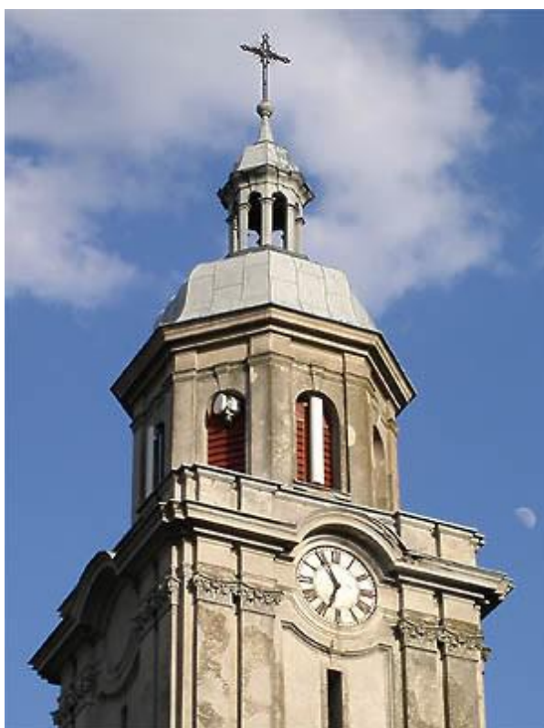
Zdj. 3. Lokalizacja urządzeń na małej wieży