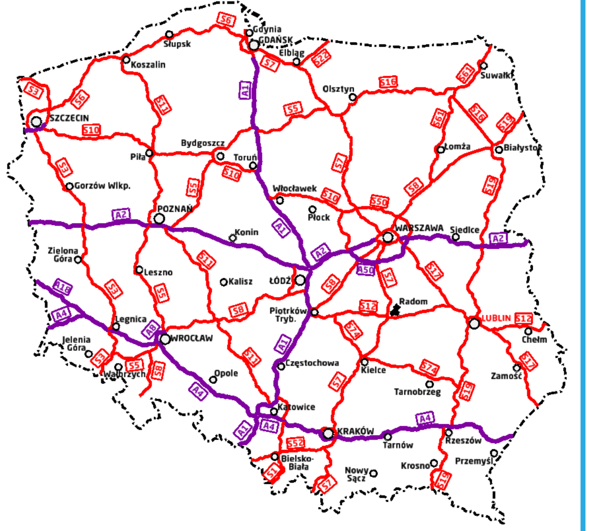
Docelowa sieć autostrad i dróg ekspresowych w Polsce